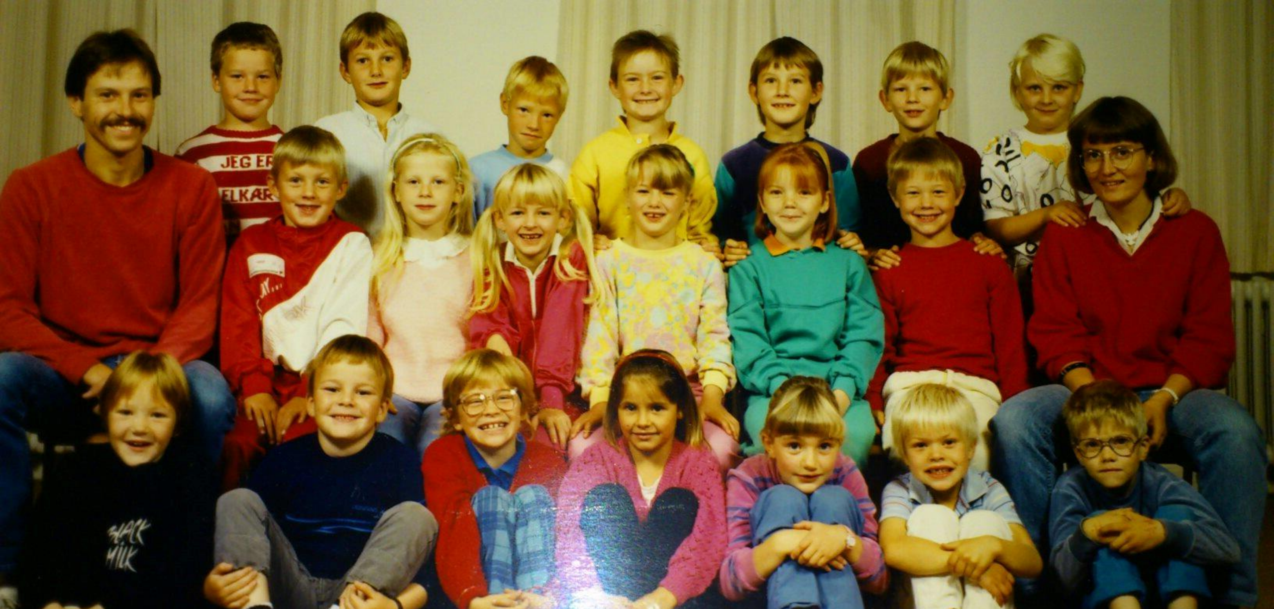
DRØMME – NYSGERRIGHED – PASSION – MOD